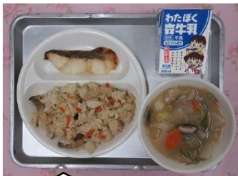
1月20日(月) ★群馬県の郷土料理★ とうふめし こしねじる