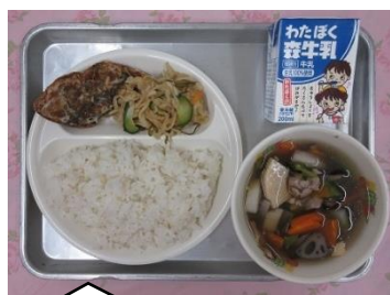
1月21日(火) ★新潟県の郷土料理★ のっぺいじる はりはりづけ