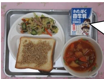
1月23日(木) □おはなし給食□ 『サラダでげんき』 げんきのでるサラダ