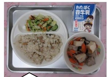
1月22日(水) ★福島県の郷土料理★ まいたけごはん ことじ