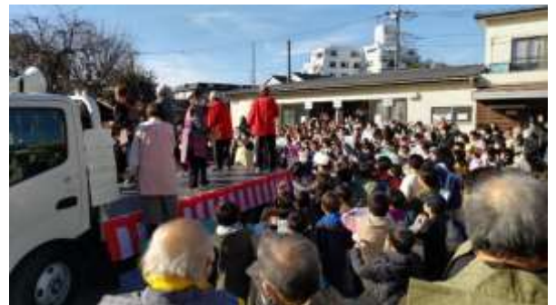
昨年度の辻育成会 豆まき大会

今年の節分は、2月2日です。どうして2月3日ではないかという、立春が2月3日になるからです。地球の公転が約365.2422日で、365日からわずかにずれているため、それを補正するのに立春が数年に一度ずれ、それに伴い節分の日もずれるのだそうです。