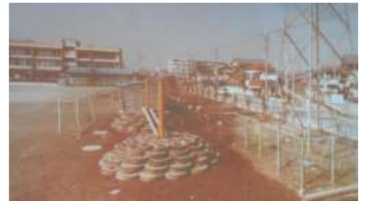
開校当時の辻小の様子

10月24、25日で6年生と日光へ修学旅行に行ってきました。猛暑と季節外れの暖かさのせいか、昨年より紅葉が進んでいませんでしたが、曇り空の中でも幸い日中は雨に降られず、充実した2日間でした。6年生の子どもたちは、さすが辻小の顔、最高学年として見学先でも、ホテルでも、とても立派な態度で辻小の伝統をしっかりと積み重ねて来てくれているなど頼もしくなりました。