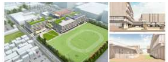
義務教育学校の完成予想図

このように、代々の子どもたちがバトンを受け継ぎ、保護者の皆様、地域の皆様に支えられ辻小は57年目を迎えました。11月22日は辻小の開校記念日です。辻小は、昭和43年、南浦和小から分かれて開校しました。その時の児童数は、475人です。平成19年に辻南小が辻小から分かれて開校したのを御記憶の方も多いと思いますが、それでも辻南小も開校して、もう17年になります。辻南小と別れて辻小の児童数は706人になりました。別れる前は、1066人もの子どもたちが在籍している大規模校でした。しかし、実は児童数が一番多かったのは、この時期ではなく、昭和50年代から平成にかけてです。昭和57年と59年が一番多く、1537人の子どもたちが在籍していました。そこで、通学区域の見直しがなされ、平成4年に白幡地区の一部が浦和別所小の通学区域となり、児童数は997人になりました。