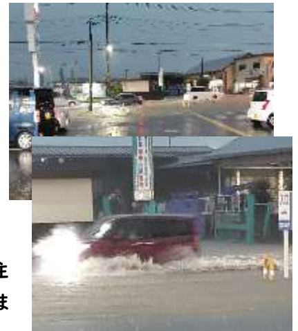
R6.8.7 西区での冠水の様子

39日間の夏休みが終わり、子どもたちの元気な声が辻小にも戻ってきました。私たち教職員は、やはり、子どもたちの楽しそうな姿を見ると、元気と勇気をもらうことができ、改めて子どもたちへの感謝の気持ちを感じます。大きなけがや病気の連絡もなく、無事に2学期をスタートできて、ほっとしているところです。さて、今年も、様々な自然の力の大きさに驚かされる夏休みでした。保護者や地域の皆様におかれましては、体調など崩されずにお過ごししてはいかがでしょうか。2学期も、どうぞよろしくお願いいたします。