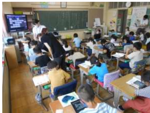
辻小 一人1台端末を使った授業風景

子どもたちが、小松菜農家の方から直接聞いた話や、教科書で学んだ情報をもとに、小松菜づくりへの思いや、工夫について話し合い、まとめていく授業でした。子どもたちは、一人1台端末でパワーポイントの共同編集機能を使って、一人ひとりが気が付いた工夫や農家の方の思いを、グループごとにまとめ、さらにクラス全体で話し合っていました。3年生とは思えないスキルで自在に端末を操り、情報や意見を交換したり、まとめたりしていて、感心させられました。辻小学校でも、一人1台端末は積極的に活用していて、その使用率は市の平均を超えています。