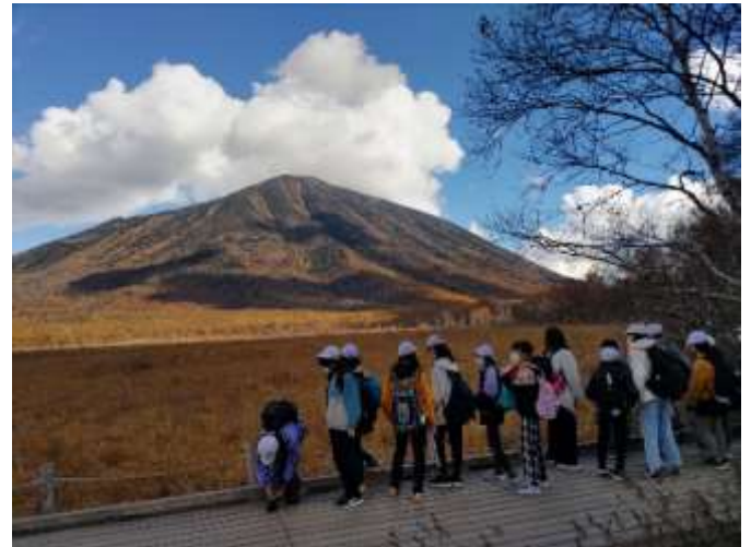
戦場ヶ原から見た男体山

そんな中で、特徴的だったのは、昨年よりも他の国から来ている観光客の方々が、とても多かったということです。新型コロナウイルスの流行が収まってきて、入国規制が緩和されたり、円安だったり、要因はいくつかあるのですが、他の国の人たちに日本の魅力、よいところを理解してもらえるのは、いいことだなと思いました。子どもたちも、グローバル・スタディの成果で、物おじせずに話しかけていて、自分の子どものころとの違いに隔世の感を覚えました。