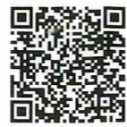
▲プレミア教室の詳細はこちら

プレミア教室は企業、大学等が主催する教室です。 応募方法等詳細は右二次元バーコードからホームページを御確認ください。 教室に関するお問い合わせは各教室の主催団体に直接お願いします。