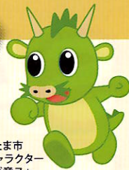
さいたま市 PRキャラクター つなが竜メウ