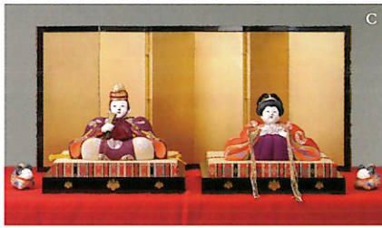
A: 次郎左衛門頭立雛 江戸時代 B: 享保雛 江戸時代 C: 稚児雛 野口光彦作 昭和時代初期 D: 紫檀象牙細工蒔絵雛道具 江戸時代 E: 芥子雛 源氏梓飾 江戸時代 ※すべて、さいたま市岩槻人形博物館蔵