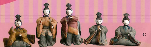
A：三人官女 江戸時代／B：古今雛 江戸時代／C：五人囃子 江戸時代 ※すべて、さいたま市岩槻人形博物館蔵