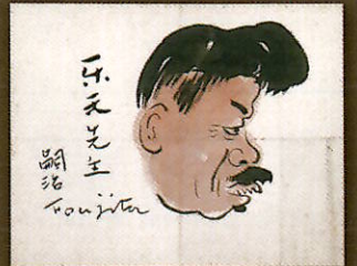
藤田嗣治「楽天先生」 昭和4年（1929）