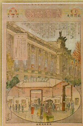
巴里風俗15 サロン・ドートンヌ『時事漫画』434号 昭和5年（1930）1月5日

本展では、楽天が世界漫遊各地で描き、一年余りにわたって表紙を飾った『時事漫画』（『時事新報』日曜付録）新聞の展示にあわせて手に取って読める実寸大複製新聞も展示いたします。