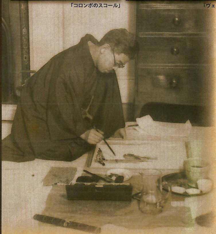
北沢楽天 ロンドンで執筆中