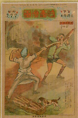
巴里見物3 パン屋の小僧『時事漫画』421号 昭和4年（1929）9月29日