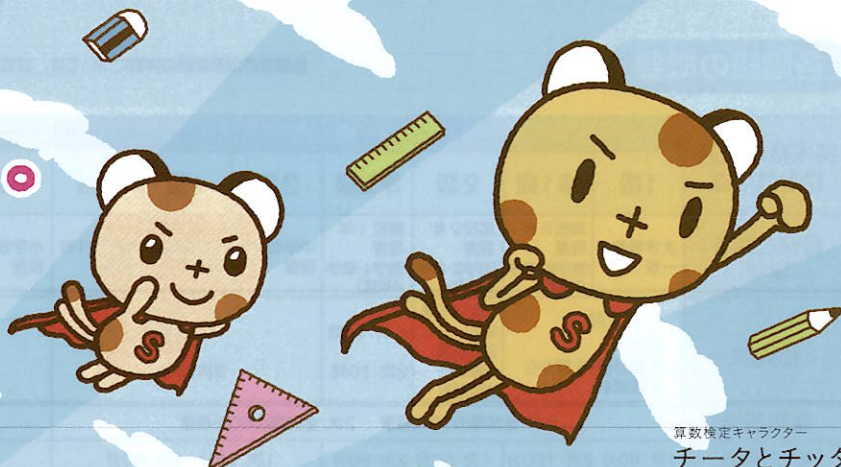
算数検定キャラクター チータとチッタ