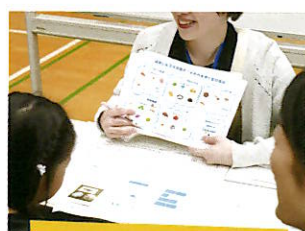
栄養ワークショップ

※開催イベントは変更となる可能性がございます。※掲載のイベント、写真は一例です。