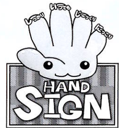
道路横断時の安全行動イメージキャラクター「サイン(SIGN)ちゃん」