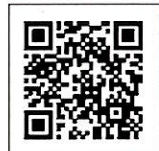
YouTube動画 埼玉県警察公式チャンネル