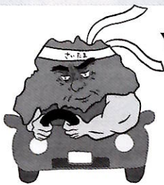
歩行者優先イメージキャラクター「さいたまお父さん」