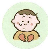
こどもの心や自尊心を傷つけるような言動をしたり、繰り返し言うこと