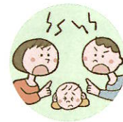
配偶者への暴力や暴言をこどもに見せること