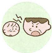
言葉で脅したり、脅迫すること

体罰は暴力でこどもの身体を傷つけるもので、心理的虐待は暴言などでこどもの心に深い傷を負わせるものです。こども本人への暴言でなくとも、配偶者や家族に対する強い言葉などもこどもの心を傷つけ、発達に影響する可能性があります。