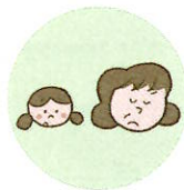
こどもを無視したり、拒否的な態度を示すこと