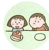
他のきょうだいは著しく差別的な扱いをすること