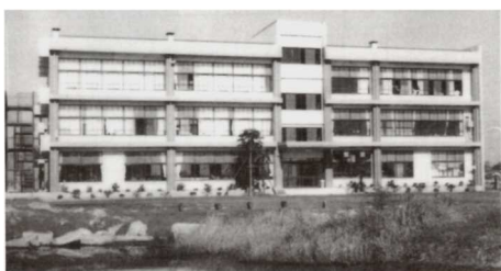
開校当時の辻小学校

1学期も残すところ3週間足らずとなりました。子どもたちが楽しみにしている夏休みも近くなってきました。各ご家庭では夏休みの計画を立て始めていることと思います。夏休みにしかできない体験をさせるなど、充実した楽しい夏休みにしてください。