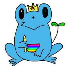
50周年記念 マスコットキャラクター 「つーじー」

また、本校はさいたま市教育委員会より平成29～31年度、さいたま市教育委員会の研究指定を受け、「社会に開かれた教育課程」等の研究に取り組んでまいります。本校の特色でもあります『地域に開かれた学校』という特色を生かし、研究を進めてまいります。